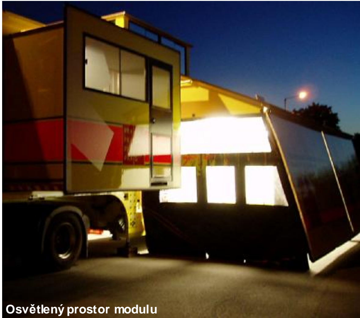
Osvětlený prostor modulu